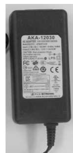
3.ACアダプター・電源ケーブル