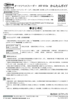
2.かんたんガイド(本書)